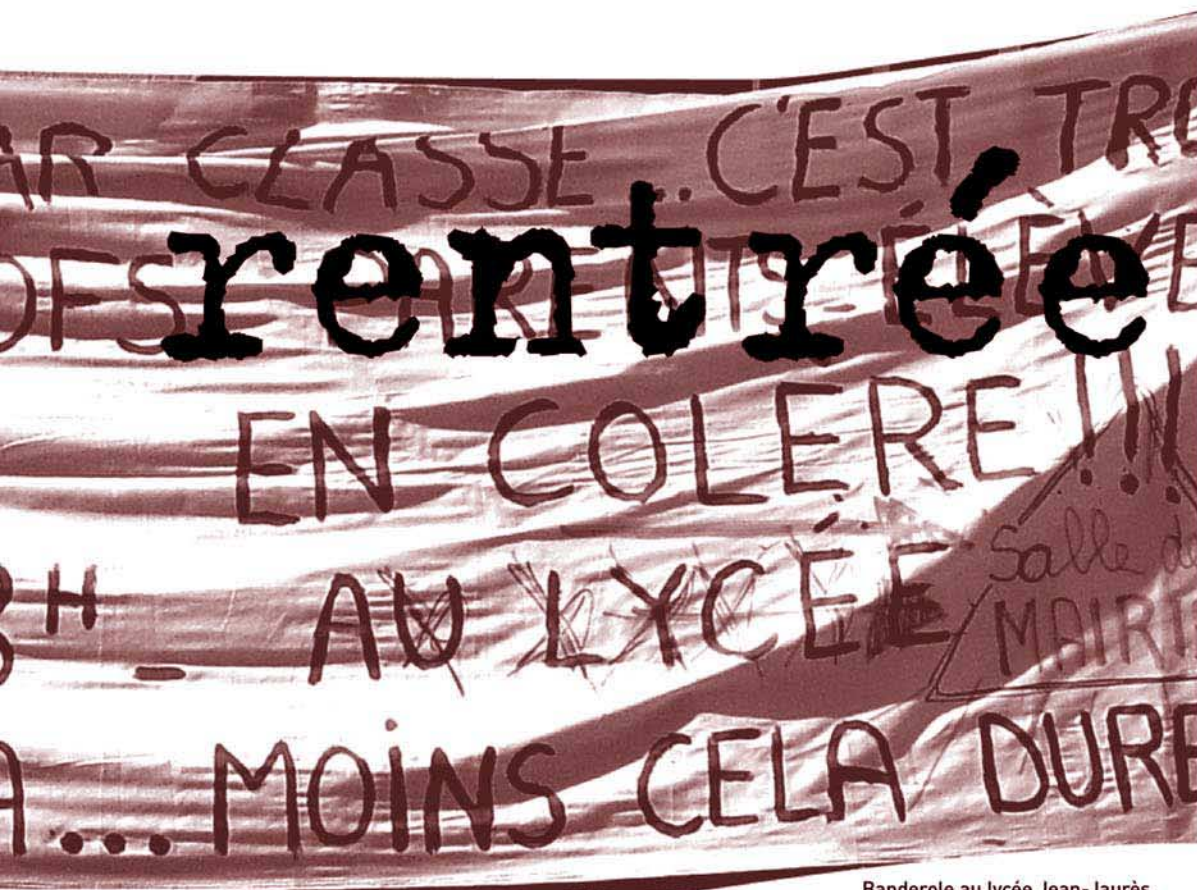
Banderole au lycée Jean-Jaurès